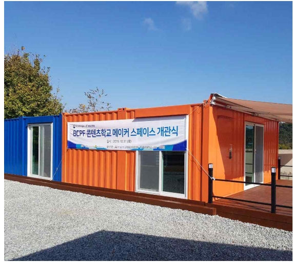
▲ <BCPF콘텐츠학교 메이커스페이스> 코워킹스페이스 & 메이커스튜디오