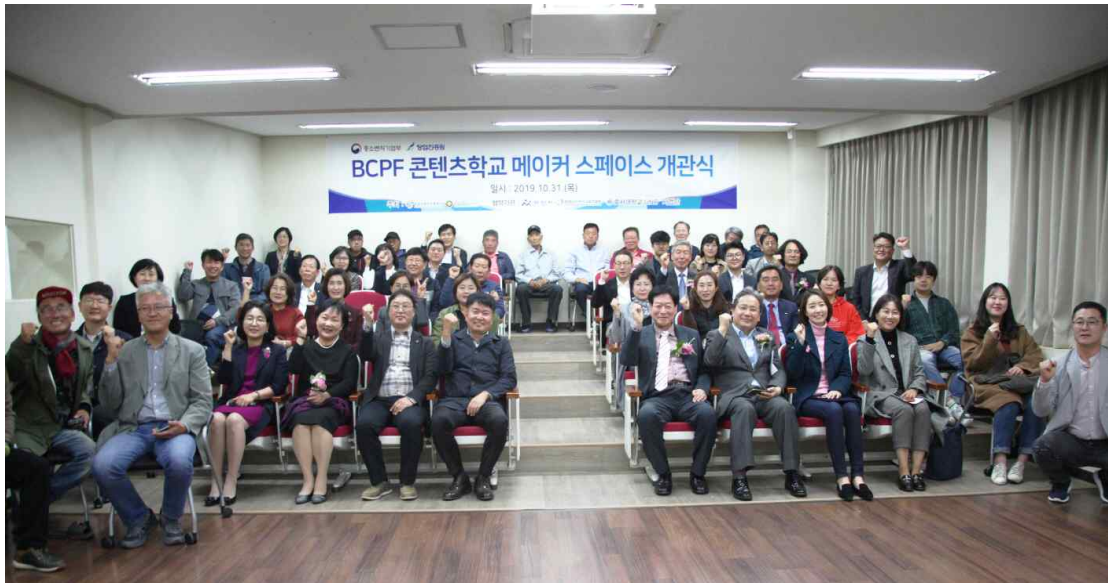
▲ <BCPF콘텐츠학교 메이커스페이스> 개관식

방송콘텐츠진흥재단(이사장 정상모)과 (주)소나기커뮤니케이션(대표 어운수)은 10월 31일 BCPF콘텐츠학교에서 협약기관인 아산시, 충청남도아산교육지원청, 호서대 산학협력단 관계자 및 도고 지역민과 함께 'BCPF콘텐츠학교 1)메이커스페이스 개관식' 을 개최했다.